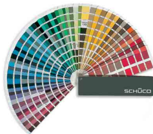
RAL- und Eloxal-Farben