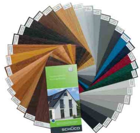
Schüco Farb- und Holzdekore