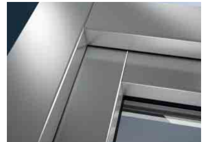
Erstklassige Gestaltungsvielfalt für Kunststoff-Fenster

Kunststoff-Fenster verfügen über die höchsten Wärmedämmstandards. Mit ihnen reduzieren Sie Ihre Heizkosten wesentlich, schonen dauerhaft Ihren Geldbeutel und leisten einen Beitrag zum Umweltschutz.